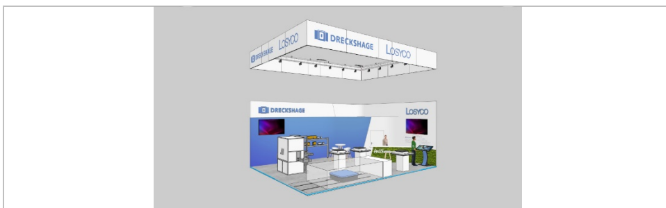
Bild 1: Auf der LogiMAT zeigt LOSYCO an seinem neu gestalteten Messestand Neuentwicklungen und Anwendungen für die Taktfertigung und Präzisionsbeschickung